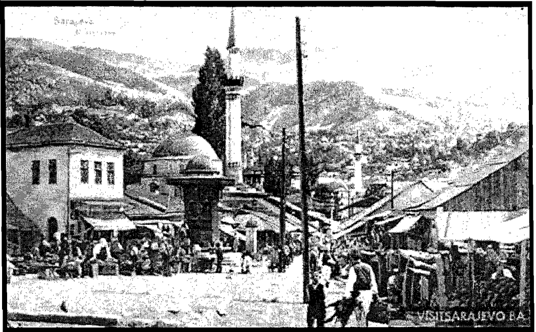
سرايفو في العهد العثماني

كانت مدينة « سرايفو » في قرنها الأول تعجّ بالتجار والحرفيين والفنيين .. وفي القرن السادس عشر كان يسكن المدينة طبقتان هامتان هما التجار والجنود وكان لكل طائفة قاضيتها الخاص ..